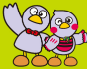
埼玉県のマスコット 「コバトン&さいたまっちゃん」