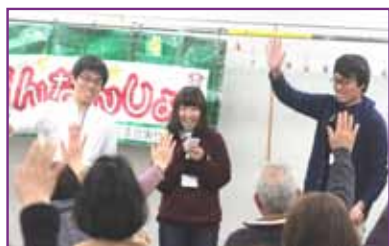
↑ 学生さんの リードであたまの体操 ↑ 声を出して つなぐ

DVD中の「あんなこと・こんなこと」では、沢山の笑顔が溢れてました。また全員の振り返りのことばがありました。