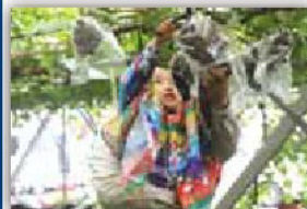
↑ハウスの中でぶどう狩りと ぶどうパイキング