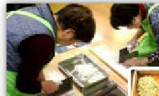
↑四人ずつの 連携そば打ち