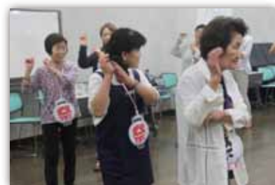
↑相馬盆唄、炭坑節、東京音頭、マイムマイム