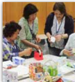
↑ソックスモンキーづくり

【歌の練習】↑ 2月の市民交流会ステージ発表に向けて始動 1曲ずつ丁寧に学んでいきます